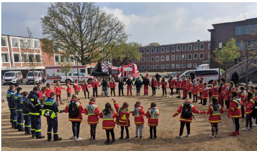
Hand in Hand fürs DRK: Das Jugendrotkreuz beim Kreiswettbewerb in Neumünster.

Das Jugendrotkreuz wird immer beliebter! 142 Kinder treffen sich regelmäßig in acht Gruppen, um Erste Hilfe zu üben, bei Veranstaltungen zu helfen und auf gemeinsamen Ausflügen viel Spaß zu haben. Der DRK-Kreisverband gewinnt so wertvollen Nachwuchs für seine Bereitschaft.